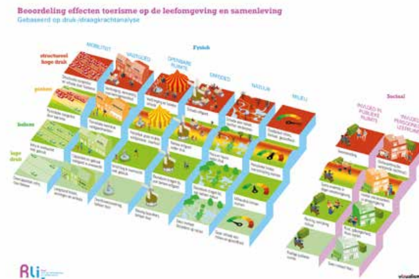
Figuur 1: Beoordeling effecten toerisme op de leefomgeving en samenleving (bron: RLI (2019) Waardevol toerisme

Raad voor de leefomgeving en infrastructuur. (2019). 'Waardevol toerisme, de leefomgeving verdient het'.