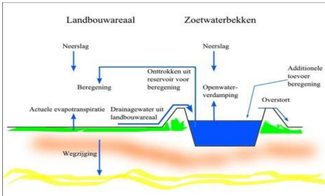
Figuur 3: Wateropslag bij open teelten